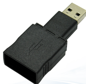
USB-adapter (digiVU <--> PC) Endast för digiVU version 4.x