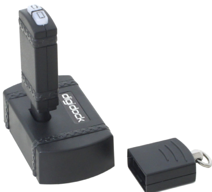
digidock (ansluts via USB till PC)